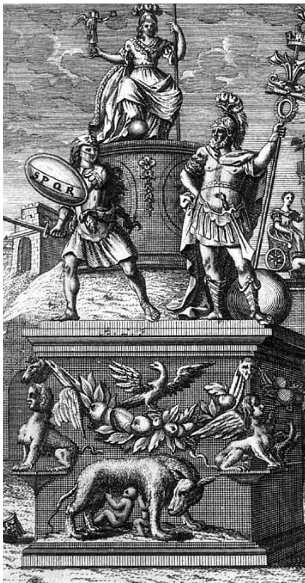
Аллегория на историю Древнего Рима Breviarium Historiae Romanae Ad Valentem Augustum Ab Urbe Condita Ad Illus usque & fratris Valentiniani tempora deductum, Atque In Usum Studiosae Juventutis Plane Et Perspicue Explicatum. – Franckfurt, 1734