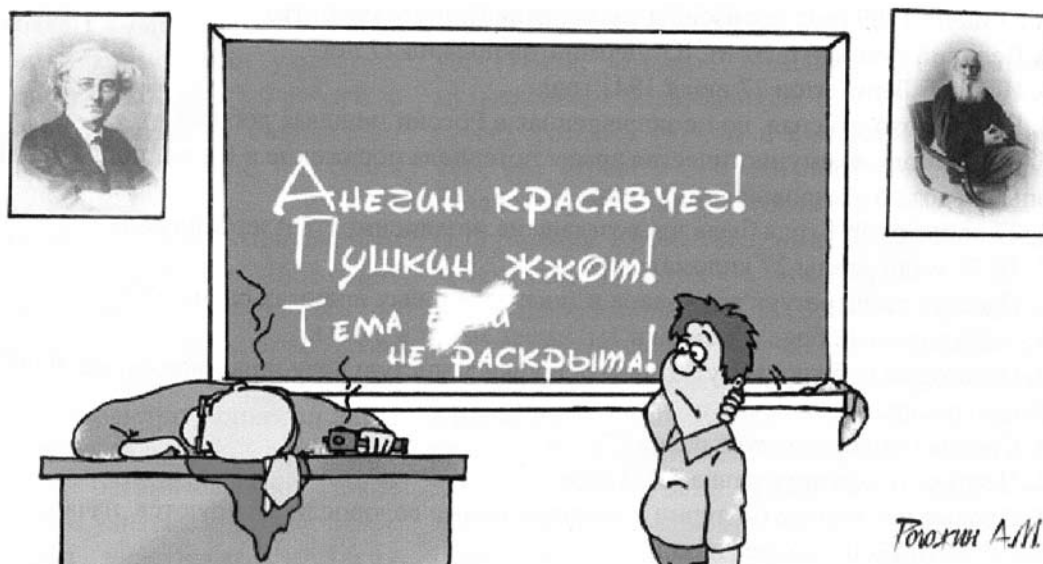
Из портфолио газеты «Мы – это будущее!», Центр образования № 654, Москва

Газета «Дело № 15», Губаха, Пермская обл.