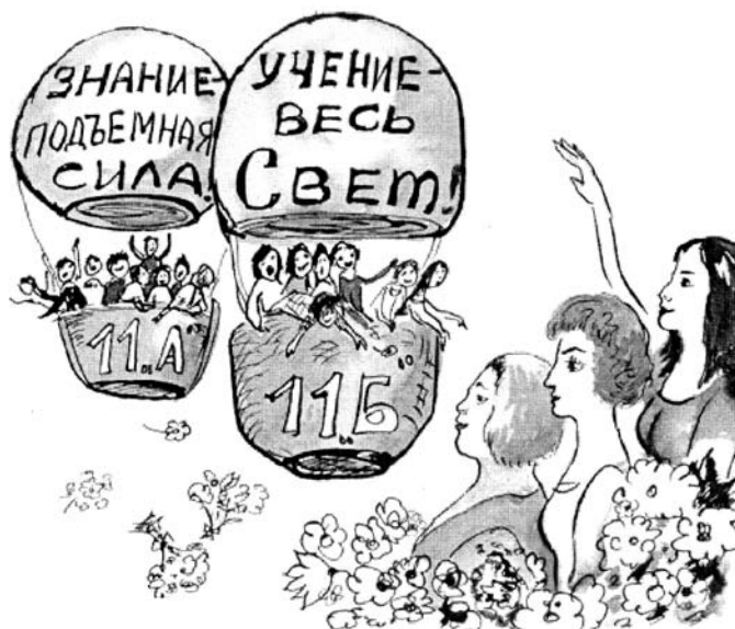
Из портфолио газеты «Ухтомский меридиан», Центр образования № 1602, Москва

Ученики ведут себя свободно, но не развязно, а учителя выглядят оптимистично