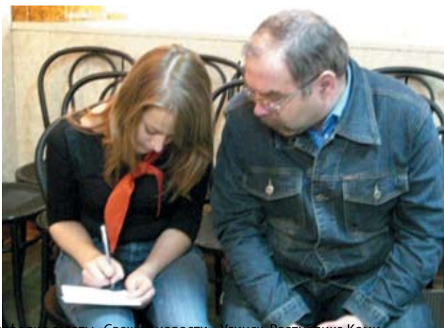
Из портфолио газеты «Свежие новости», Усинск, Республика Коми

«Класс! ный журнал», п. Малаховка, Московская обл.