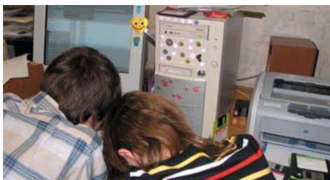
Из портфолио газеты «Откровение», Дворец творчества детей и молодежи, Братск, Иркутская обл.

Газета «Лицейский вестник», Протвино, Московская обл.