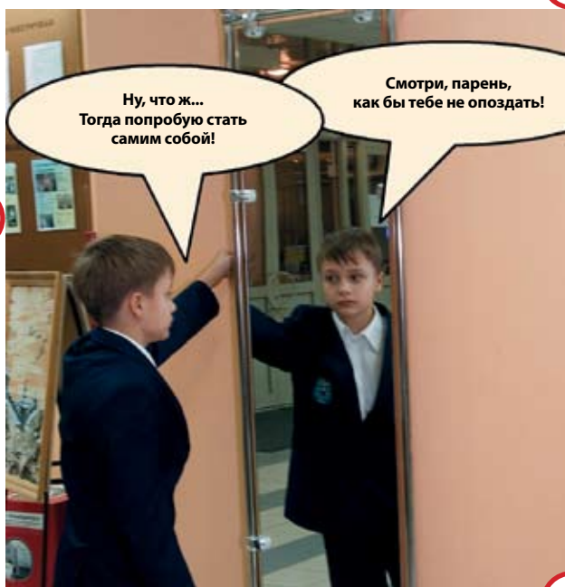
Из портфолио народной школьной газеты «Контакт!», школа № 1259, Москва