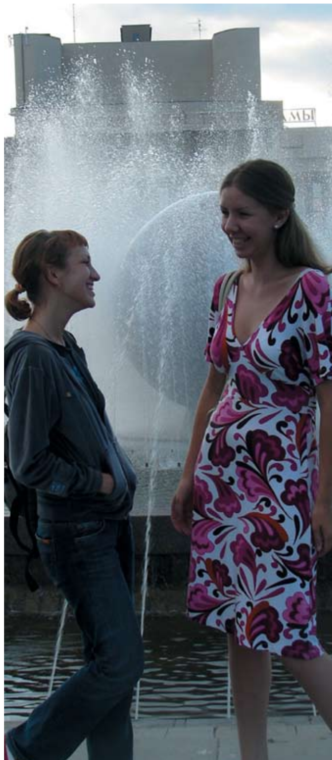
Из портфолио журнала «Класс!», гимназия № 177, Екатеринбург