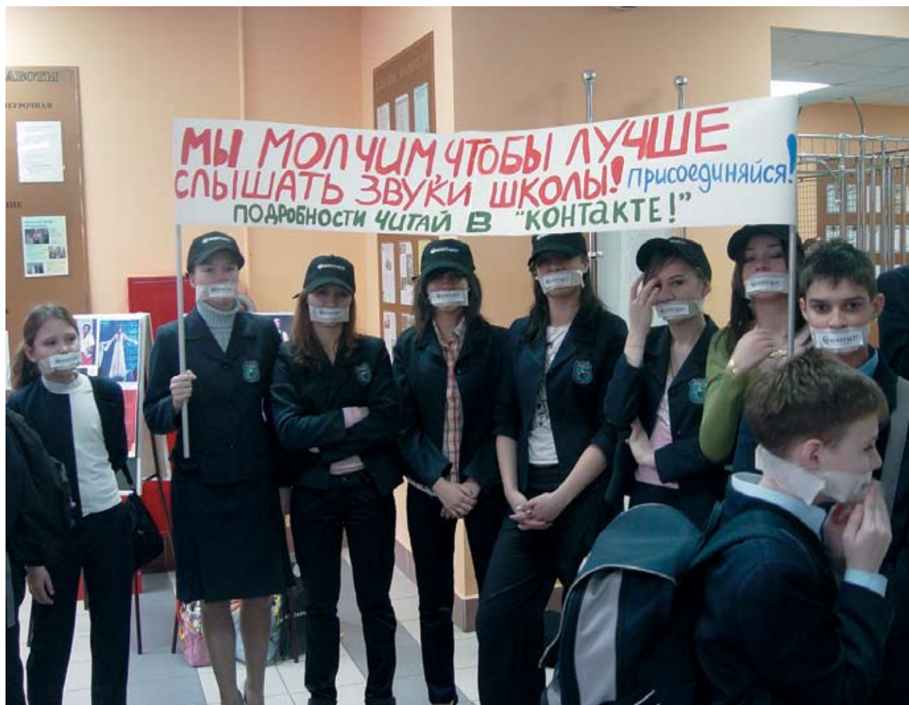
Из портфолио народной школьной газеты «Контакт!», школа № 1259 с углубленным изучением английского языка, Москва