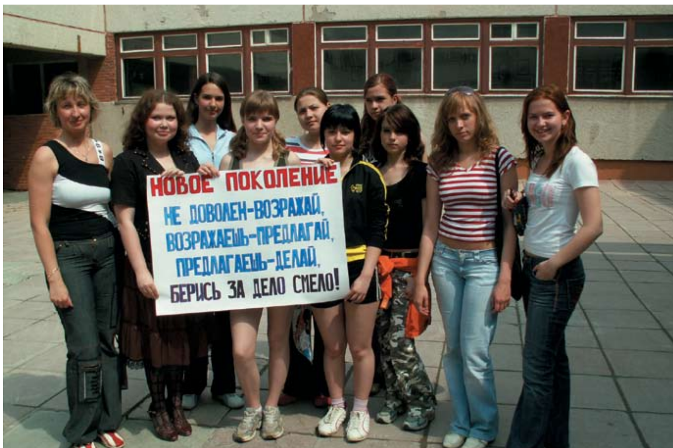
Из портфолио газеты «Образовательный kaleйдоскоп», Межшкольный учебный комбинат, Новоуральск, Свердловская обл.

«А что вы тут делаете?» – «Идем к директору за тряпкой»