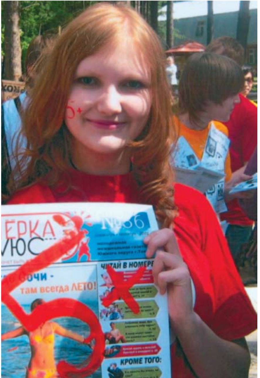
Из портфолио журнала «Класс!», гимназия № 177, Екатеринбург

Газета «Медико-экологический листок», Нижний Новгород