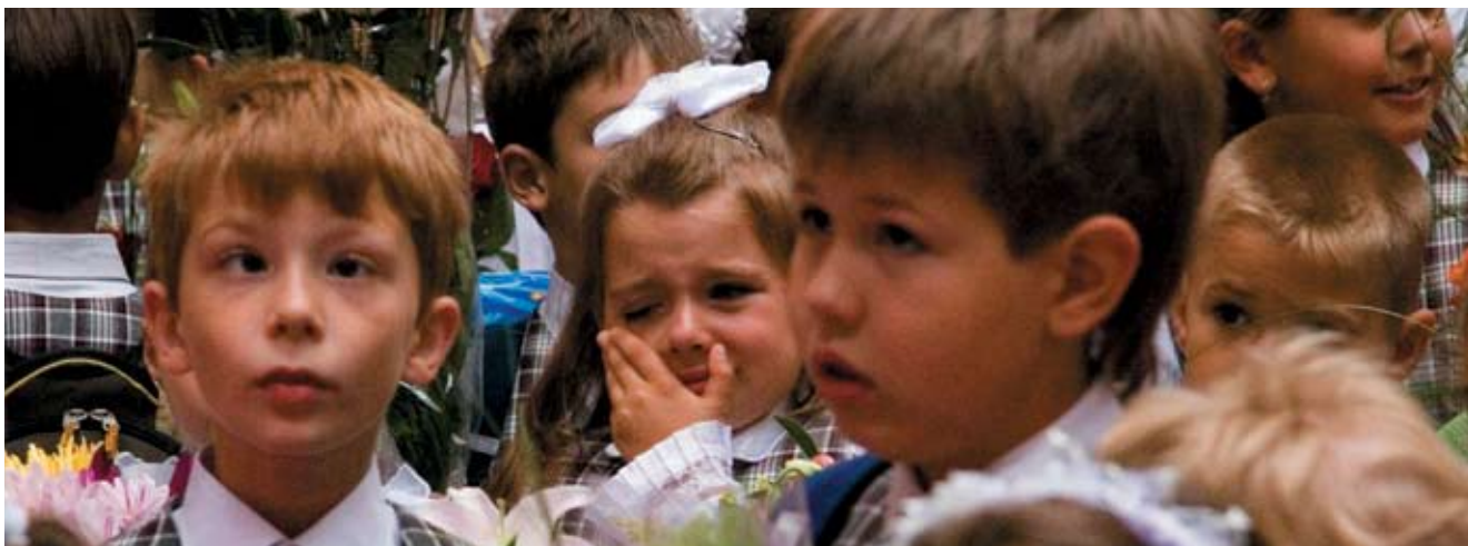
Из портфолио газеты «Окно», школа № 1354, Москва