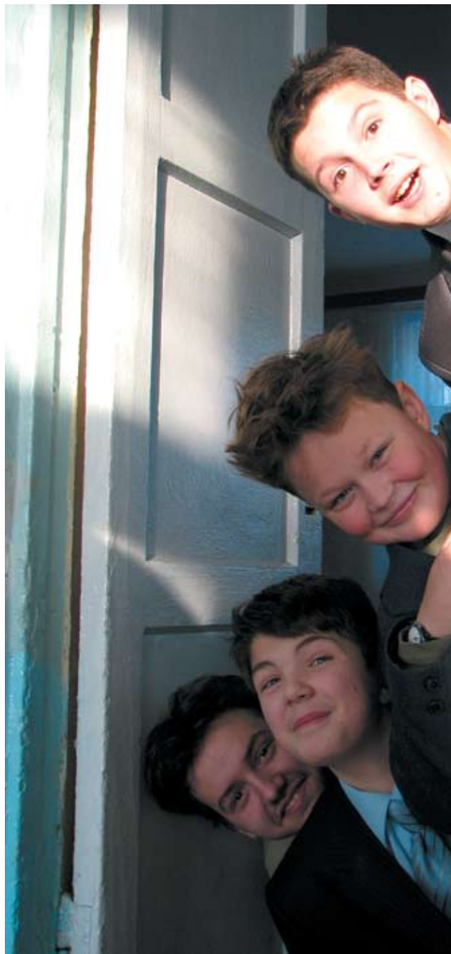
Из портфолио газеты «Зеркало», школа № 19, Ковров, Владимирская обл.